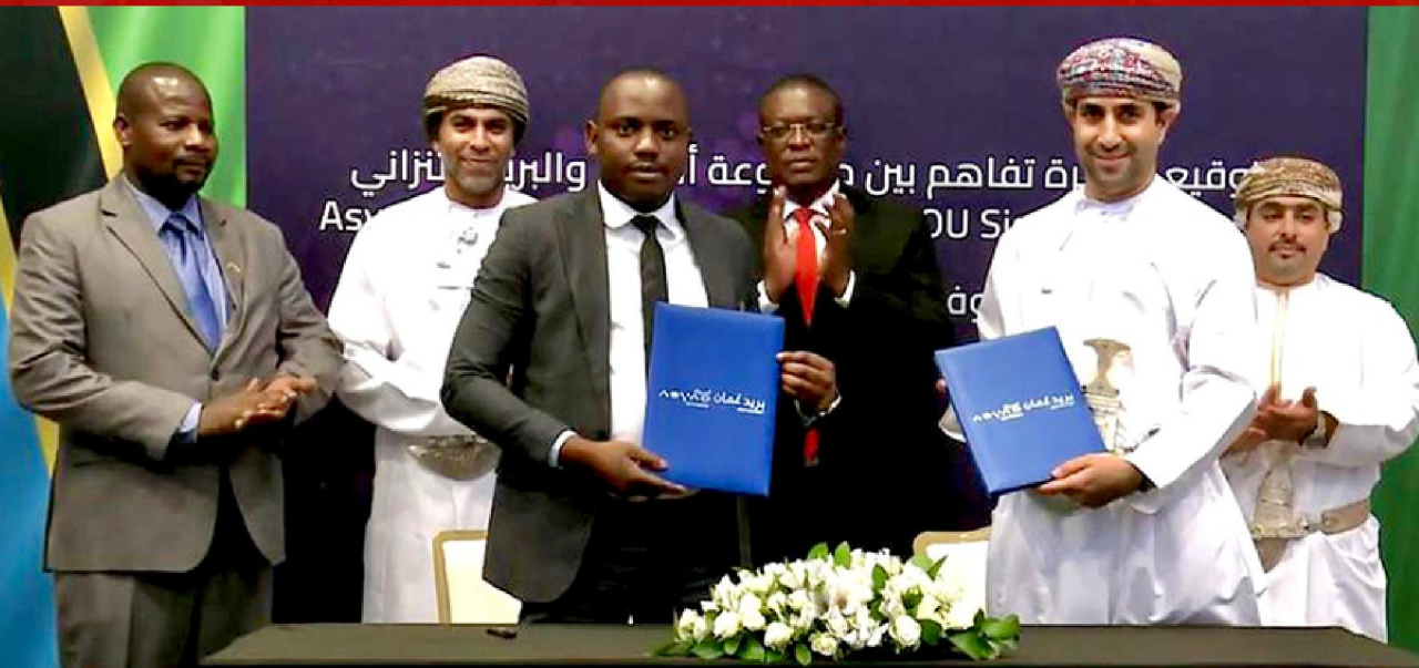
NEWS Asyad Group signs MoU with Tanzania Posts on multimodal logistic park in Dar Es Salaam